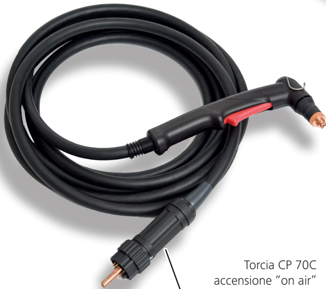
Torcia CP 70C accensione "on air"