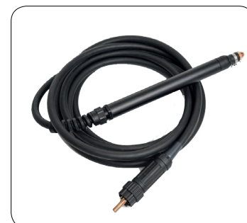
CP70C DAR 6 m art. 1627