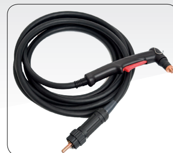
CP70C MAR 6 m art. 1626